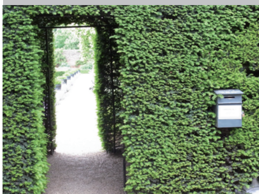
▶こんな素敵なガゼボをくぐってお庭に入ります。