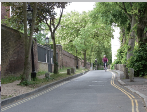
▶急な坂が多いですが、歩いていて楽しい風情があります。