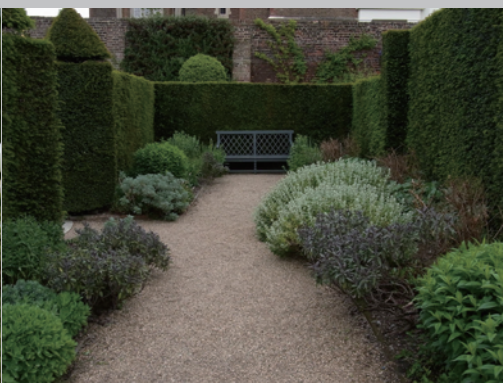
▶色の変化がきれいなボーダーガーデン