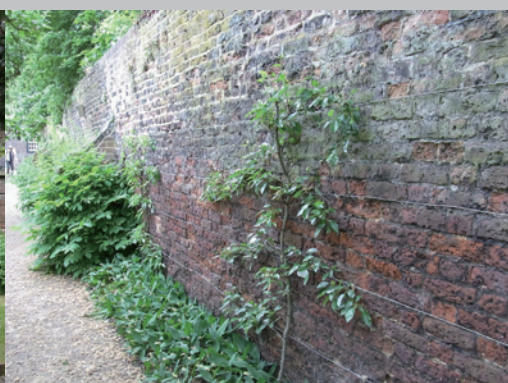
▶塀際でエスペリエに創られた樹木は、目隠しの塀に移植されていると思います。