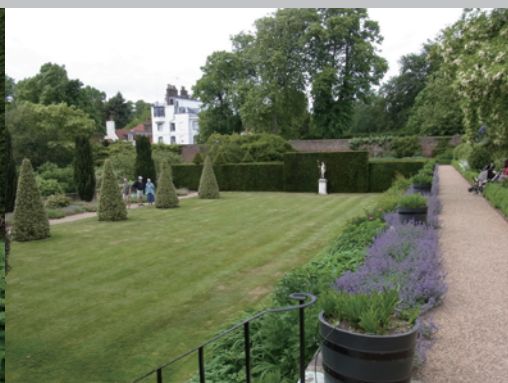
▶なんとも贅沢な空間です。