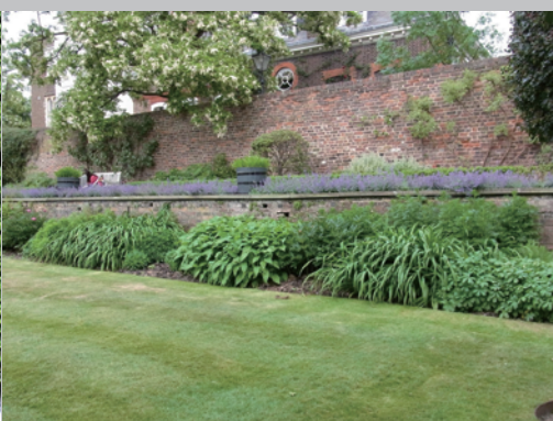
▶梅雨がないから、フウチソウもギボウシもでっかいです。