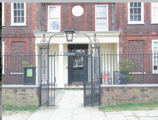
▶正面玄関です。ナショナルトラスト管理の表札があります。