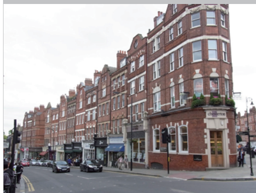
▶ハムステッド 往来の多い街角から住宅街に入っていきます。