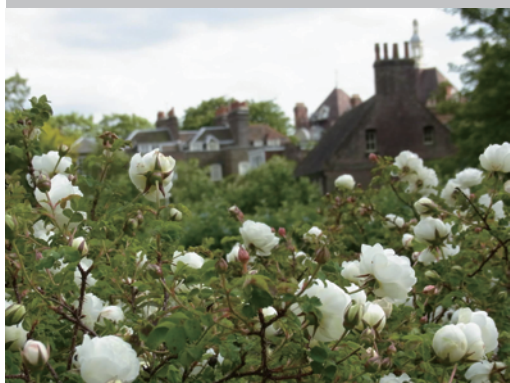
▶イングリッシュローズ始め、花もたくさん咲いています。